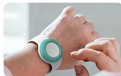
Bouton d'appel IP67 (résistance eau & poussières)