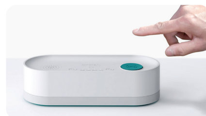
Base d'appel équipé d'un micro et haut-parleur. Relié au secteur 230v.